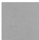
Nr. 10 Naturgrau

Ein Sichtschutz-Konzept der außergewöhnlichen Art